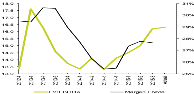
FV/Ebitda* y Margen Ebitda*