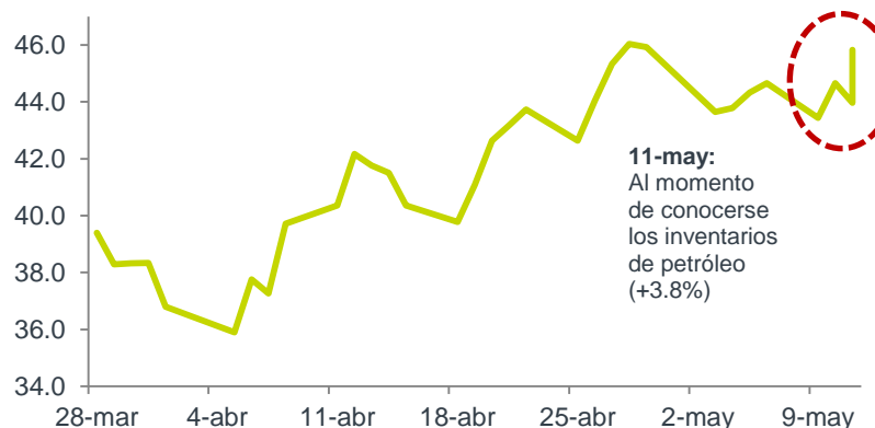
Precio del Petróleo, WTI (dólares por barril)