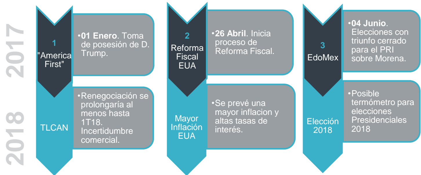
Figura 1. Hitos 2017

El año pasado estuvo marcado por diferentes elementos clave que impactaron a los mercados financieros. Ejemplo de lo anterior es la toma de posesión de Donald Trump como presidente de EUA y sus acciones en torno a la renegociación del Tratado de Libre Comercio de América del Norte (TLCAN) y la Reforma Fiscal. En la presente nota, identificamos siete hitos de 2017 que tienen el potencial de seguir repercutiendo en el 2018, mismos que ordenamos por orden cronológico para posteriormente describir brevemente la consecuencia que tendrán este año que comienza.