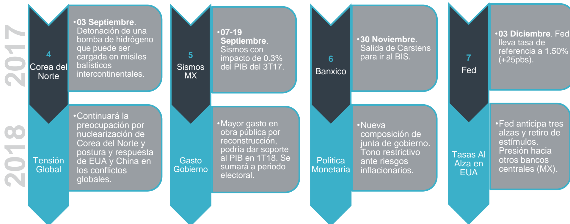
Figura 2. Hitos 2017

La economía global ha mostrado un mayor crecimiento económico, lo que indica que los estímulos monetarios aplicados después de la crisis de 2008 ya no son necesarios. Es por ello que la Reserva Federal (Fed) se encuentra en un proceso de reducción de la hoja de balance y alza en las tasas de interés. A dicho contexto, se le suma la entrada en vigor de la Reforma Fiscal (enero de 2018), que dentro de sus características destaca el recorte en los impuestos corporativos de 35.0% a 21.0%. Pensamos que la Fed estará vigilante del desempeño de la inflación y que responderá agresivamente en caso de que dicha variable se presione más de lo previsto por consecuencia de la Reforma Fiscal. Ello podría generar a su vez respuesta de otros bancos centrales como el mexicano a través de presiones en el tipo de cambio en la inflación (variable objetivo). Si además consideramos la nueva composición de la junta de gobierno con la salida de Agustín Carstens, el tono restrictivo que ha mostrado la junta de gobierno con una inflación que no cede y los riesgos de mayor volatilidad al tipo de cambio dentro de un contexto de alta incertidumbre, la política monetaria local se enfrentará a retos importantes este año.