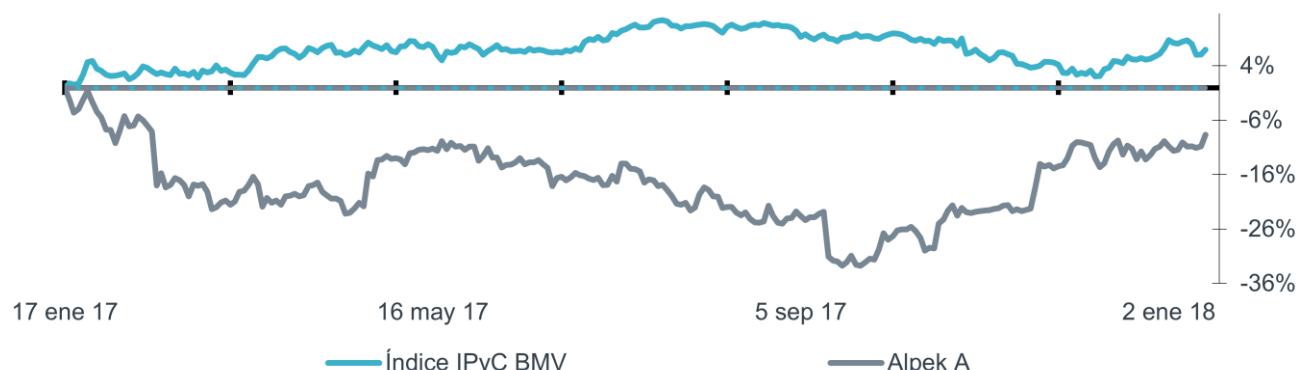
IPyC vs. ALPEK (U12M)

El nuevo monto será distribuido en partes para brindar la liquidez que garantice las operaciones si y solo si cumple con las condiciones incluyendo la aprobación de todos los acreedores en el plan de reestructura. Por otro lado, no contamos con información correspondiente a la planta de Suape, Brasil en la cual Alpek preveía de PTA (ácido tereftálico purificado), ni el proyecto de la planta de PTA-PET en Corpus Christi.