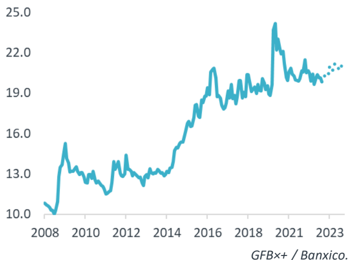
GFBx+ / Banxico.